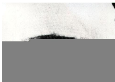
Rys. P9(d) z [1/4] (tj. O9(d) z [1/3]) przed zasabotażowaniem.